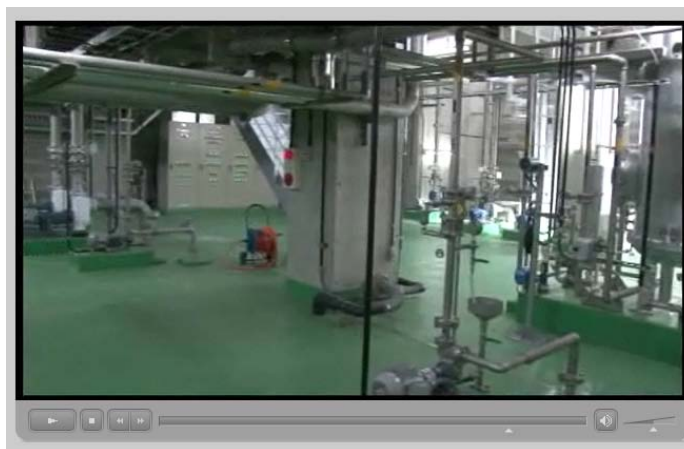
図1 大学社会生活論「環境論」ビデオ

FD・ICT 教育推進室では、ビデオコンテンツ作成の相談も承っております。不明点等ございましたら、ご連絡ください。【文責・竹本寛秋】