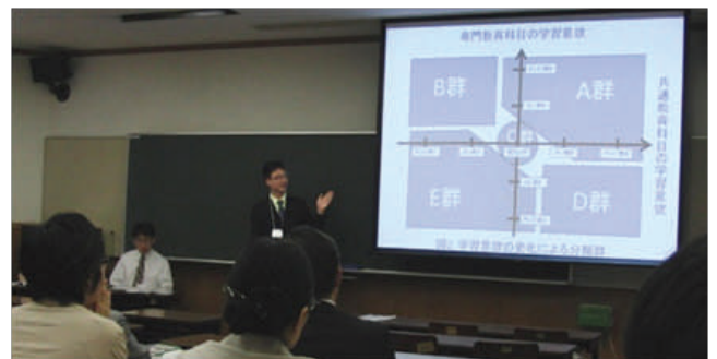
金沢大学1年生の学習意欲と意味ある授業 (末本 哲雄)